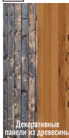
Декоративные панели из древесины