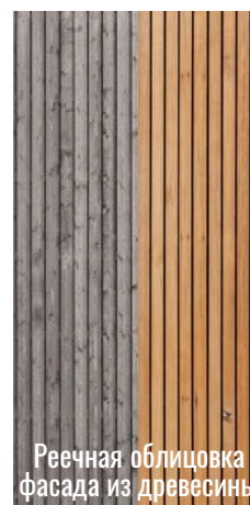
Реечная облицовка фасада из древесины